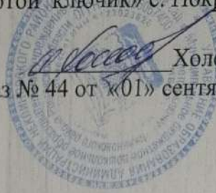
График аттестации педагогических работников на 2023 – 2024 учебный год