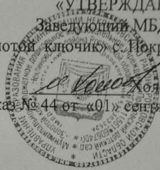
График аттестации педагогических работников на 2021 – 2022 учебный год